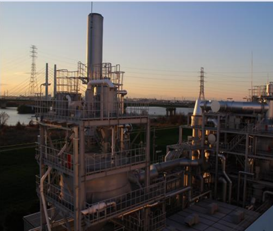
水循環センターの撮影イメージ