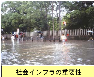
社会インフラの重要性