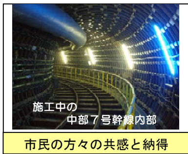
市民の方々の共感と納得

現在、平成11年の水害を契機に市民の方や観光客などの多くの人が集まり、都市機能が集積する都心部の天神周辺地区で、「レインボープラン天神」と称し、都心部の安全・安心の基盤づくりを積極的に進めています。