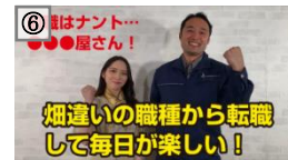
⑥ 前はナント... ●●●屋さん! 畑違いの職種から転職 して毎日が楽しい!

当社の若手女性社員とミス日本「水の天使」の3人の対談では、業界への印象等を語るとともに、当社の魅力も対談でお伝えした。また、当社HPの採用ページでは 入社2～3年目の若手社員の本音トークを動画で公開 することで、 業界で働く人の雰囲気や働き方、考え方などを伝えている(⑥⑦) 。面接に来てくださった方の中には「採用ページの社員の方の雰囲気が良くて応募した」という方もいらっしゃり、社員の心のこもった内容が視聴者にもしっかりと伝わっていた。さらに別事業の社員にも対談に協力してもらうことで、当社の広報活動や下水道事業への社内の理解度向上にもつながった。