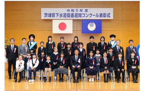
<受賞者 集合写真 >