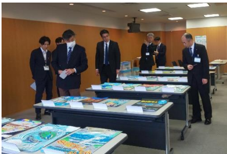
<コンクール審査会 >