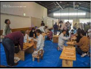
マンホールリ-風景