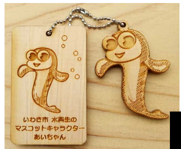
いわき産木材 ストラップ