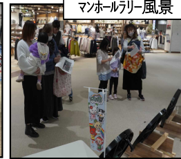
マンホールリ-風景