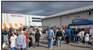
マンホールリ-受付風景