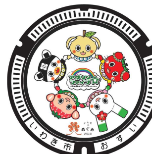
アゲリンファイブ