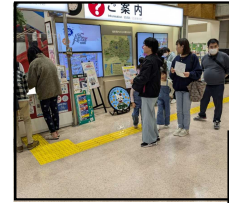
マンホールリ-風景