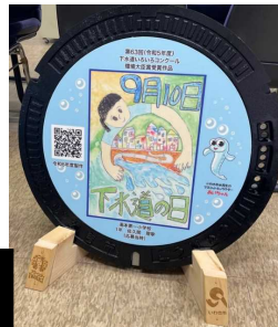
いわき産木材 マンホール台座