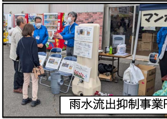
雨水流出抑制事業PR風景