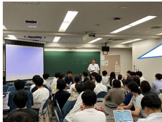
▲ 貫上教授による講評

・参加型の授業を通じて、学生が下水道とGXとのかかわりに関心を持ち、グループディスカッションや発表に取り組むことができ、有意義な時間となりました。（貫上教授の講評）