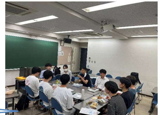
▲ GKP未来会による就職相談