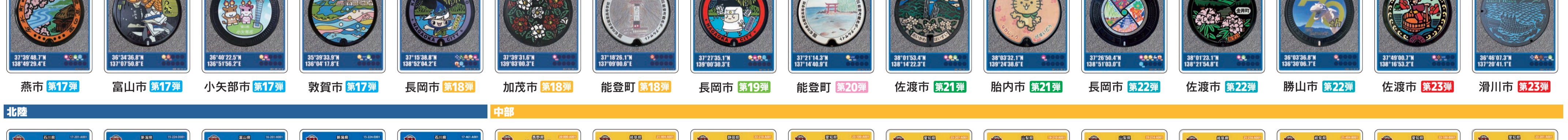
燕市 第17弾 富山市 第17弾 小矢部市 第17弾 敦賀市 第17弾 長岡市 第18弾 加茂市 第18弾 能登町 第18弾 長岡市 第19弾 能登町 第20弾 佐渡市 第21弾 胎内市 第21弾 長岡市 第22弾 佐渡市 第22弾 勝山市 第22弾 佐渡市 第23弾 滑川市 第23弾