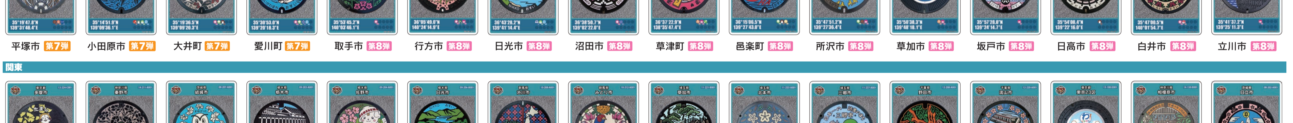
平塚市 第7弾 小田原市 第7弾 大井町 第7弾 愛川町 第7弾 取手市 第8弾 行方市 第8弾 日光市 第8弾 沼田市 第8弾 草津町 第8弾 邑楽町 第8弾 所沢市 第8弾 草加市 第8弾 坂戸市 第8弾 日高市 第8弾 白井市 第8弾 立川市 第8弾