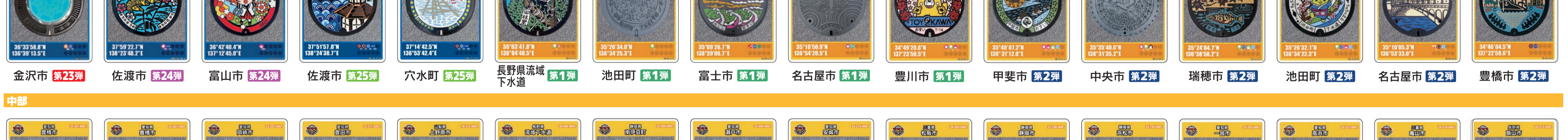
金沢市 第23弾 佐渡市 第24弾 富山市 第24弾 佐渡市 第25弾 穴水町 第25弾 長野県流城下水道 第1弾 池田町 第1弾 富士市 第1弾 名古屋市 第1弾 豊川市 第1弾 甲斐市 第2弾 中央市 第2弾 瑞穂市 第2弾 池田町 第2弾 名古屋市 第2弾 豊橋市 第2弾