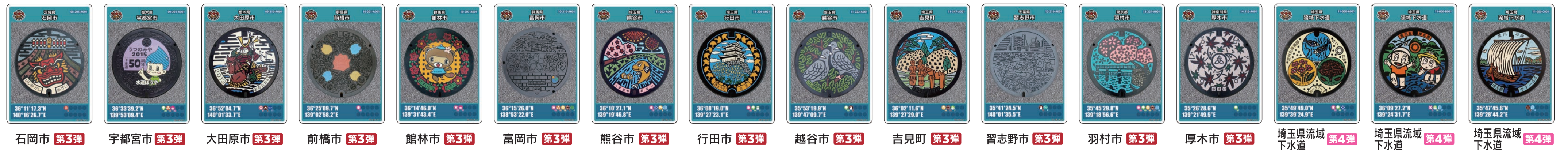
石岡市 第3弾 宇都宮市 第3弾 大田原市 第3弾 前橋市 第3弾 館林市 第3弾 富岡市 第3弾 熊谷市 第3弾 行田市 第3弾 越谷市 第3弾 吉貝町 第3弾 習志野市 第3弾 羽村市 第5弾 厚木市 第3弾 埼玉県流域下水道 第4弾 埼玉県流域下水道 第4弾 埼玉県流域下水道 第4弾