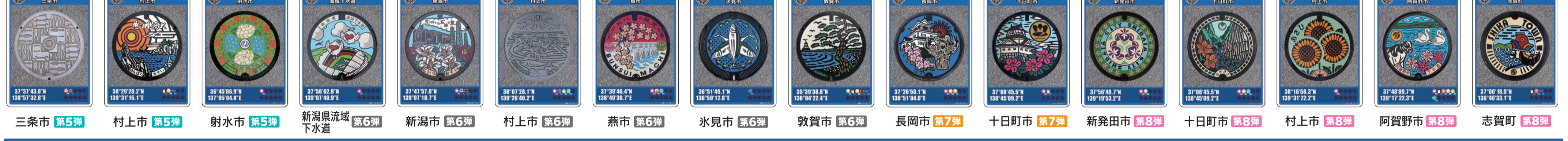
三糸市 第5弾 村上市 第5弾 射水市 第5弾 新潟県流城下水道 第6弾 新潟市 第6弾 村上市 第6弾 燕市 第6弾 氷見市 第6弾 敦賀市 第6弾 長岡市 第7弾 十日町市 第7弾 新発田市 第8弾 十日町市 第8弾 村上市 第8弾 阿賀野市 第8弾 志賀町 第8弾