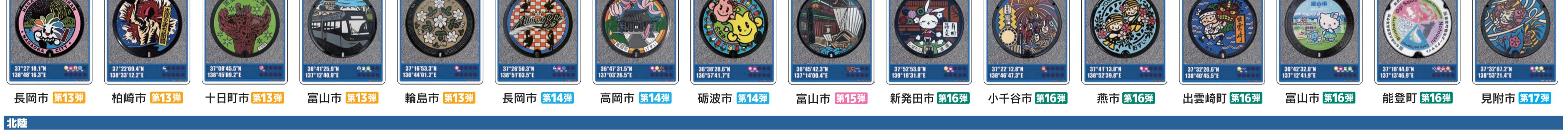
長岡市 第13弾 柏崎市 第13弾 十日町市 第13弾 富山市 第13弾 輪島市 第13弾 長岡市 第14弾 高岡市 第14弾 砺波市 第14弾 富山市 第15弾 新発田市 第16弾 小千谷市 第16弾 燕市 第16弾 出雲崎町 第16弾 富山市 第16弾 能登町 第16弾 見附市 第17弾