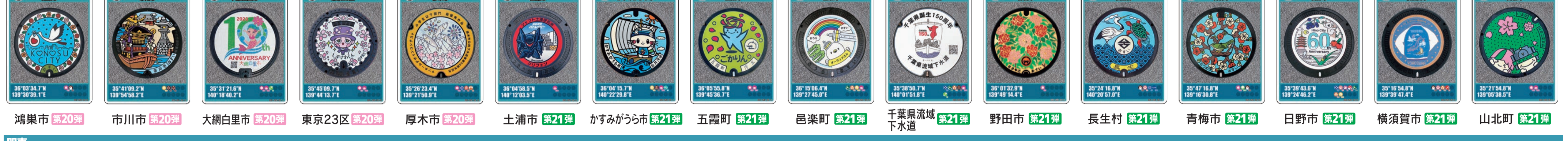
鴻巣市 第20弾 市川市 第20弾 大網白里市 第20弾 東京23区 第20弾 厚木市 第20弾 土浦市 第21弾 かすが市 第21弾 五霞町 第21弾 邑楽町 第21弾 千葉県流城下水道 第21弾 野田市 第21弾 長生村 第21弾 青梅市 第21弾 日野市 第21弾 横須賀市 第21弾 山北町 第21弾