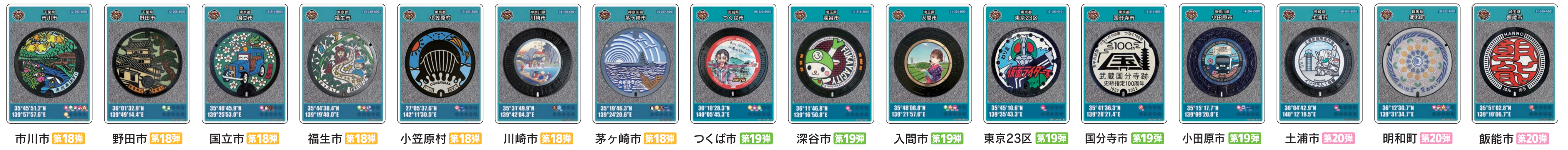
市川市 第18弾 野田市 第18弾 国立市 第18弾 福生市 第18弾 小笠原村 第18弾 川崎市 第18弾 茅ヶ崎市 第18弾 つくば市 第19弾 深谷市 第19弾 入間市 第19弾 東京23区 第19弾 国分寺市 第19弾 小田原市 第19弾 土浦市 第20弾 明和町 第20弾 飯能市 第20弾