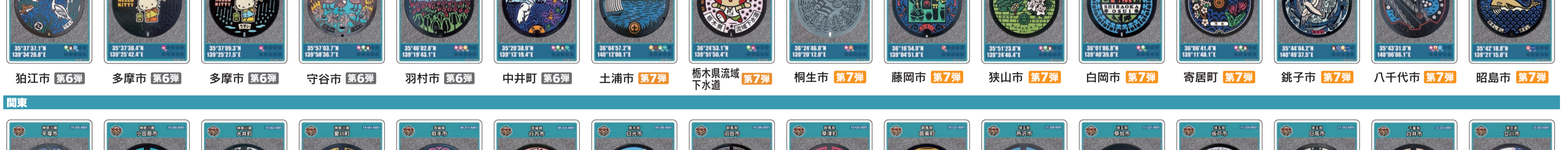
狛江市 第6弾 多摩市 第6弾 多摩市 第6弾 守谷市 第6弾 羽村市 第6弾 中井町 第6弾 土浦市 第7弾 栃木県流域下水道 第7弾 桐生市 第7弾 蕨岡市 第7弾 狭山市 第7弾 白岡市 第7弾 寄居町 第7弾 銚子市 第7弾 八千代市 第7弾 昭島市 第7弾