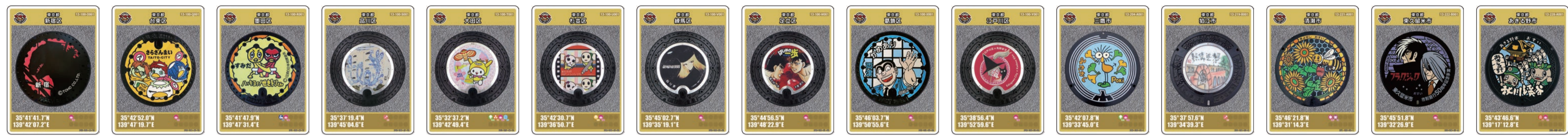
新宿区 特別版 台東区 特別版 墨田区 特別版 品川区 特別版 大田区 特別版 杉並区 特別版 練馬区 特別版 足立区 特別版 葛飾区 特別版 江戸川区 特別版 三鷹市 特別版 狛江市 特別版 清瀬市 特別版 東久留米市 特別版 あきる野市 特別版