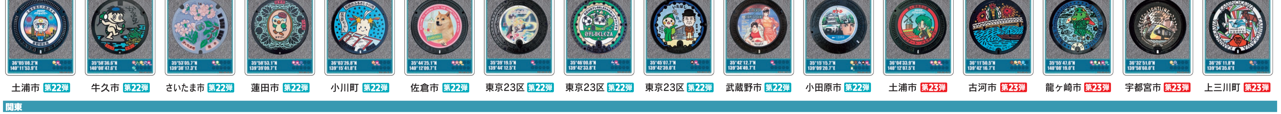
土浦市 第22弾 牛久市 第22弾 さいたま市 第22弾 蓮田市 第22弾 小川町 第22弾 佐倉市 第22弾 東京23区 第22弾 東京23区 第22弾 東京23区 第22弾 武蔵野市 第22弾 小田原市 第22弾 土浦市 第23弾 古河市 第23弾 龍ヶ崎 第23弾 宇都宮市 第23弾 上三川町 第23弾