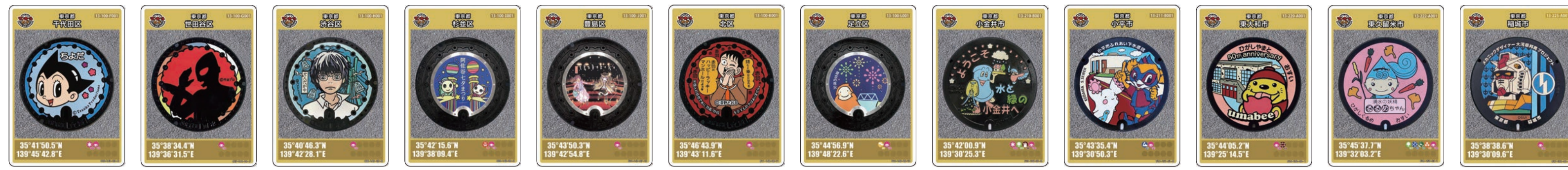
千代田区 特別版 世田谷区 特別版 渋谷区 特別版 杉並区 特別版 豊島区 特別版 北区 特別版 足立区 特別版 小金井市 特別版 小平市 特別版 東大和市 特別版 東久留米市 特別版 稲城市 特別版