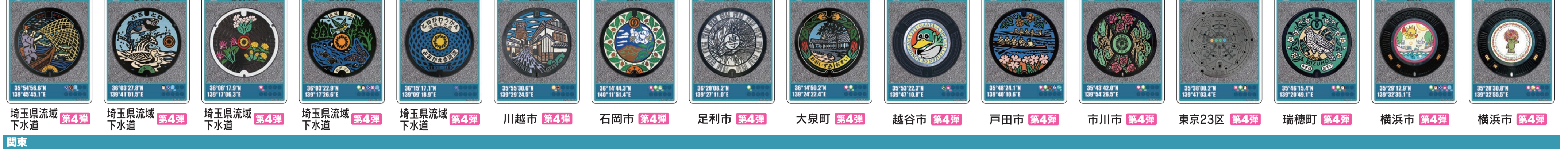
埼玉県流域下水道 第4弾 埼玉県流域下水道 第4弾 埼玉県流域下水道 第4弾 埼玉県流域下水道 第4弾 川越市 第4弾 石岡市 第4弾 足利市 第4弾 大東町 第4弾 越谷市 第4弾 戸田市 第4弾 市川市 第4弾 東京23区 第4弾 瑞穂町 第4弾 横浜市 第4弾 横浜市 第4弾