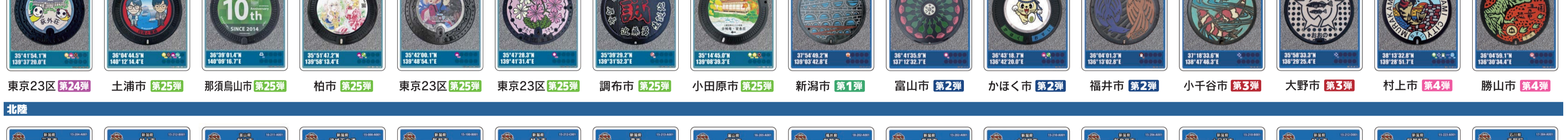
東京23区 第24弾 土浦市 第25弾 那須烏山市 第25弾 柏市 第25弾 東京23区 第25弾 東京23区 第25弾 調布市 第25弾 小田原市 第25弾 新潟市 第1弾 富山市 第2弾 かほく市 第2弾 福井市 第2弾 小千谷市 第3弾 大野市 第3弾 村上市 第4弾 勝山市 第4弾