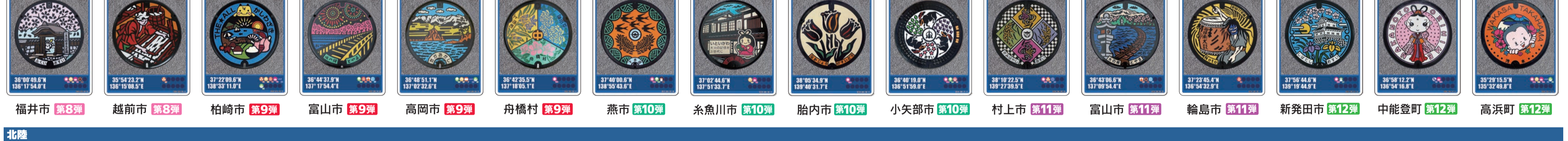
福井市 第8弾 越前市 第8弾 柏崎市 第9弾 富山市 第9弾 高岡市 第9弾 舟橋村 第9弾 燕市 第10弾 糸魚川市 第10弾 胎内市 第10弾 小矢部市 第10弾 村上市 第11弾 富山市 第11弾 輪島市 第11弾 新発田市 第12弾 中能登町 第12弾 高浜町 第12弾