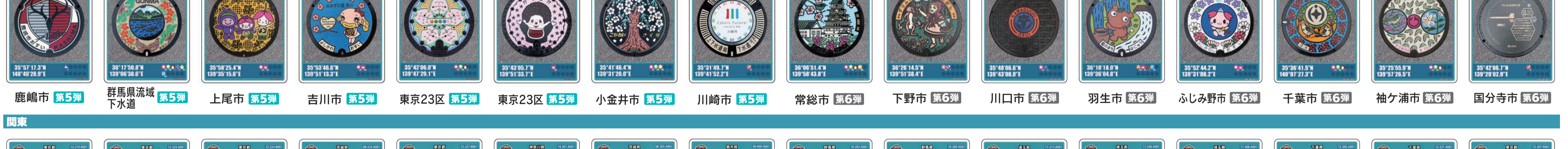
鹿嶋市 第5弾 群馬県流域下水道 第5弾 上尾市 第5弾 吉川市 第5弾 東京23区 第5弾 東京23区 第5弾 小金井市 第5弾 川崎市 第5弾 常総市 第6弾 下野市 第6弾 川口市 第6弾 羽生市 第6弾 ふじみ野市 第6弾 千葉市 第6弾 袖ヶ浦市 第6弾 国分寺市 第6弾