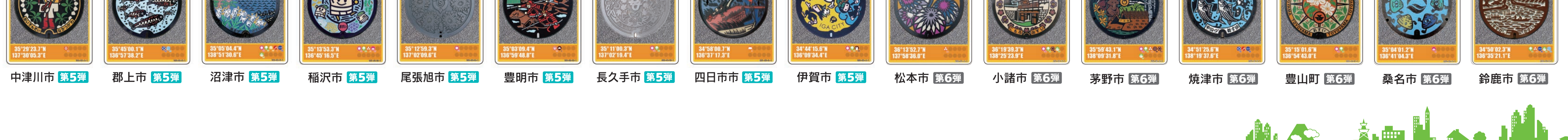
中津川市 第5弾 郡上市 第5弾 沼津市 第5弾 稲沢市 第5弾 尾張旭市 第5弾 豊明市 第5弾 長久手市 第5弾 四日市市 第5弾 伊賀市 第5弾 松本市 第6弾 小諸市 第6弾 茅野市 第6弾 焼津市 第6弾 豊山町 第6弾 桑名市 第6弾 鈴鹿市 第6弾