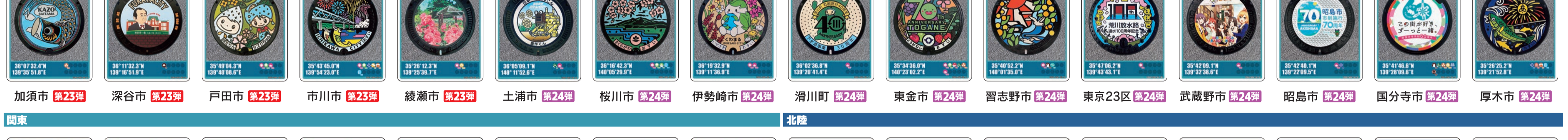
加須市 第23弾 深谷市 第23弾 戸田市 第23弾 市川市 第23弾 綾瀬市 第23弾 土浦市 第24弾 桜川市 第24弾 伊勢崎市 第24弾 滑川町 第24弾 東金市 第24弾 習志野市 第24弾 東京23区 第24弾 武蔵野市 第24弾 昭島市 第24弾 国分寺市 第24弾 厚木市 第24弾