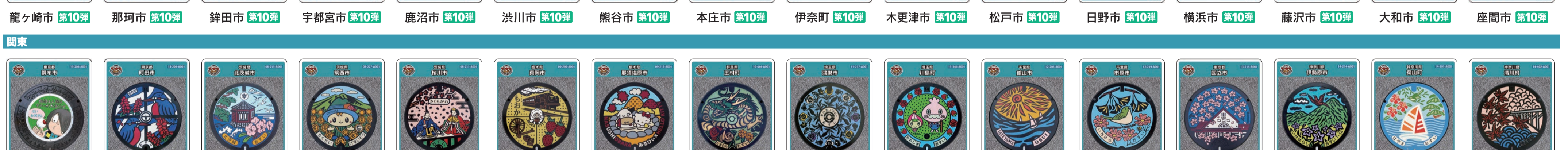
龍ヶ崎市 第10弾 那珂市 第10弾 鉾田市 第10弾 宇都宮市 第10弾 鹿沼市 第10弾 渋川市 第10弾 熊谷市 第10弾 本庄市 第10弾 伊奈町 第10弾 木更津市 第10弾 松戸市 第10弾 日野市 第10弾 横浜市 第10弾 藤沢市 第10弾 大和市 第10弾 座間市 第10弾