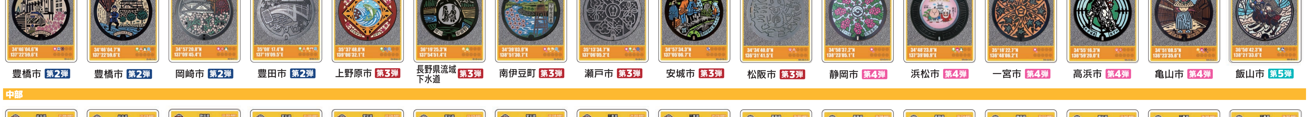
豊橋市 第2弾 豊橋市 第2弾 岡崎市 第2弾 豊田市 第2弾 上野原市 第3弾 長野県流城下水道 第3弾 南伊豆町 第3弾 瀬戸市 第3弾 安城市 第3弾 松阪市 第3弾 静岡市 第4弾 浜松市 第4弾 一宮市 第4弾 高浜市 第4弾 亀山市 第4弾 飯山市 第5弾